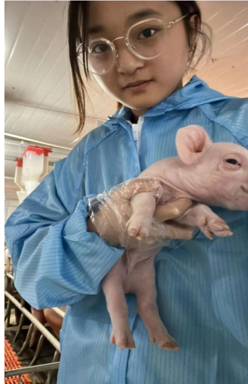
图 10 学徒岗位实习图片