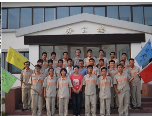
图 6 正大班开班仪式