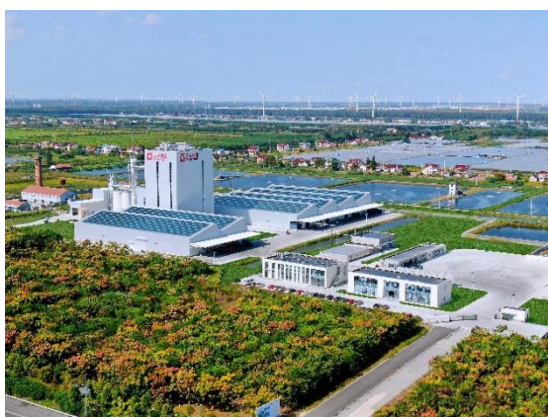
图 1 正大水产（南通）有限公司

正大集团自 1990 年起在江苏南通、泰州、淮安、连云港、徐州、盐城等地先后设立企业 12 家，主营业务包括饲料生产销售、畜禽及水产养殖、食品加工贸易等，是江苏省的饲料生产和畜禽及水产养殖的企业联合体，业务范围覆盖整个江苏省及周边省市。目前已形成饲料、养殖、食品深加工、餐饮、零售的全产业链模式，打造从农场到餐桌的绿色产业链，将健康、安全、美味的食品送入千家万户。