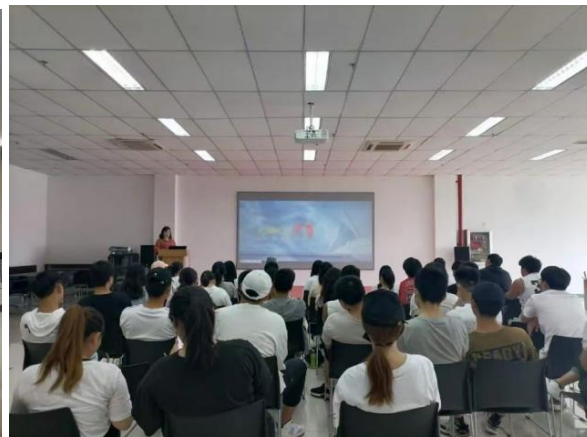
图 8 正大班学生学校导师培训