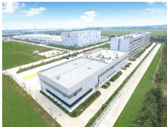
图 1 正大食品（徐州）有限公司