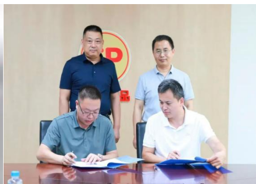
图4 校企合作签约仪式