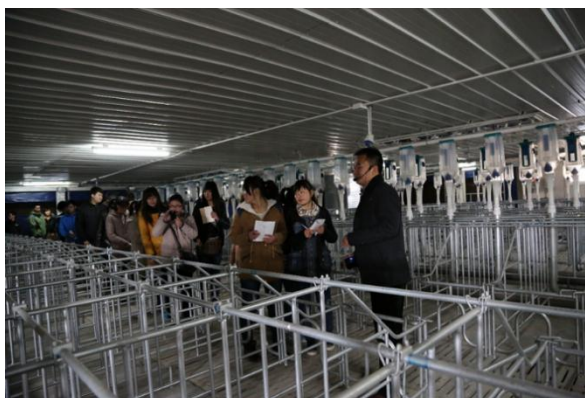
图 5 企业师傅现场教学