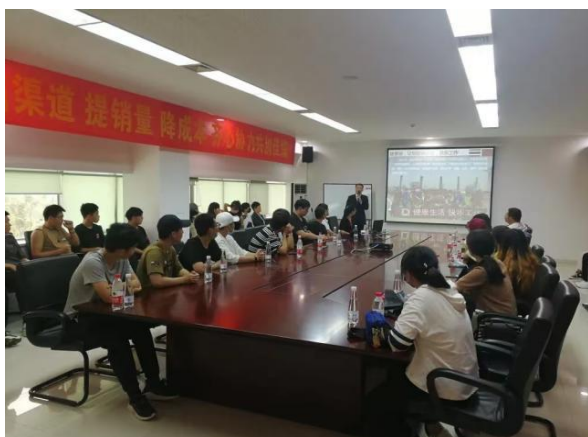
图 7 正大班学生企业导师培训

由学校选拔优秀专任教师，企业选拔优秀技术人员和操作能手，建立“双导师”团队，共同开展现代学徒制教学。现代养殖技术团队成功入选江苏省现代职业教育“双师型”名师工作室。