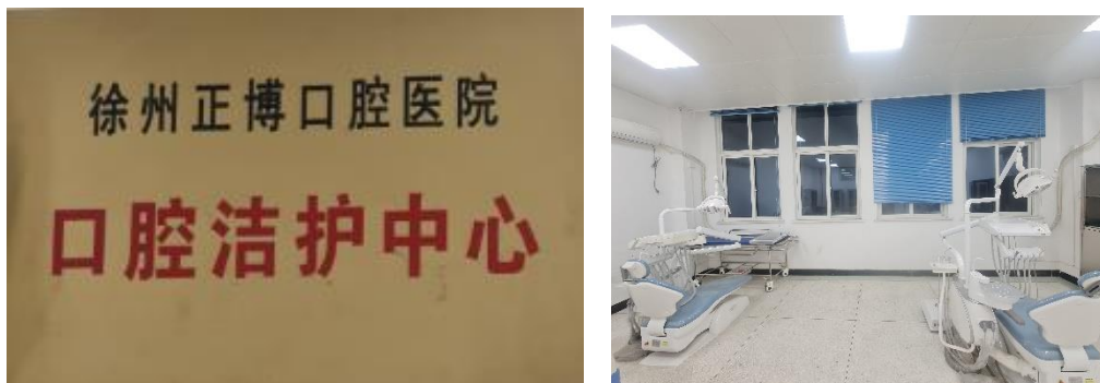
图4 共建口腔洁护实训中心

双方着力提升口腔医学教学基础，医院出资在校内精心打造口腔洁护实训中心，配备先进的口腔洁护设备，模拟真实的临床操作环境，全力支持学院口腔护理专业的实践教学环节。