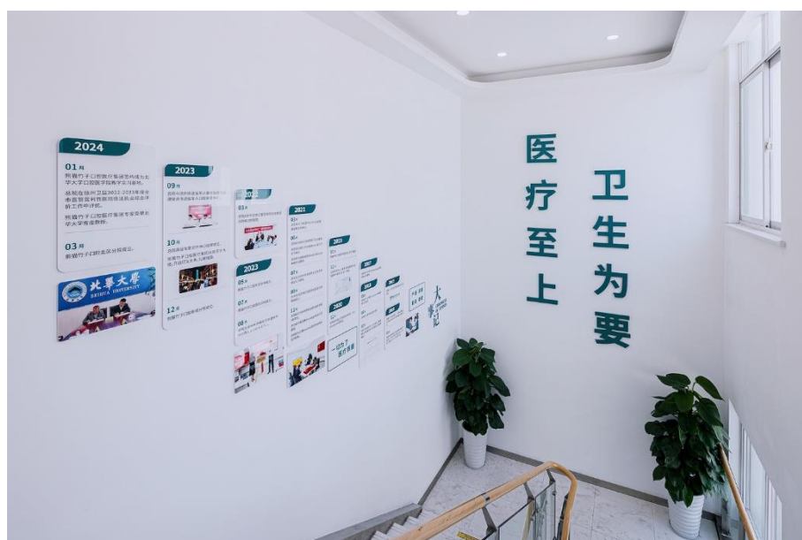
图 2 医院文化

诊疗中心等 7 大学科中心，高级专家诊疗中心 1 个，重点特色专科 3 个，公益卫生服务科室 1 个。