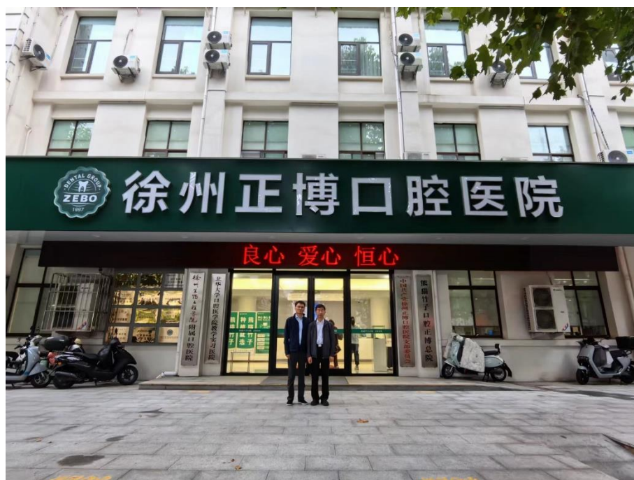
图 1 徐州正博口腔医院

徐州正博口腔医院隶属于熊猫竹子口腔医疗集团，始建于 2016 年，总部位于江苏省徐州市。依托强大的人才储备及医疗技术优势，现已快速发展成为集口腔医疗、教学、科研、预防、保健于一体的大型多元化口腔医疗，覆盖淮海经济区。