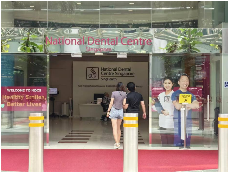
图 7 赴新加坡 National Dental Centre Singapore (NDCS) 专业调研

附属口腔医院全力助力学校口腔卫生保健专业设置工作，赴新加坡 National Dental Centre Singapore (NDCS) 开展专业调研。