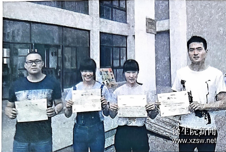
图4 获万邦奖学金的学生