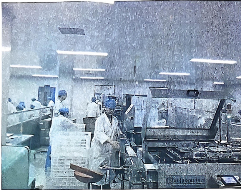
图3 订单班学生在企业技能训练