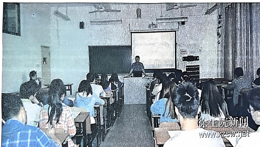
图2 万邦企业导师正在授课

在真实的工作环境中，按照规范的职业标准开展项目实训，为学生营造了良好的职业训练氛围，对学生专业技能和实践技能的提升起到了极大的作用，第二部分是理论知识教学，注重学生的理论知识掌握能力，狠抓课本，以课本知识为出发点，首先应使学生掌握理论知识，在实践中加以应用，真正做到将课本知识学活。万邦集团将工作中的实际问题反馈给学校，让师生在课堂上运用所学知识解决问题，将万邦集团的工作内容作为实践课程的作业，加强考核，学生的最终成绩由企业导师及学校老师共同给出，提高学生学习的积极性与主动性。